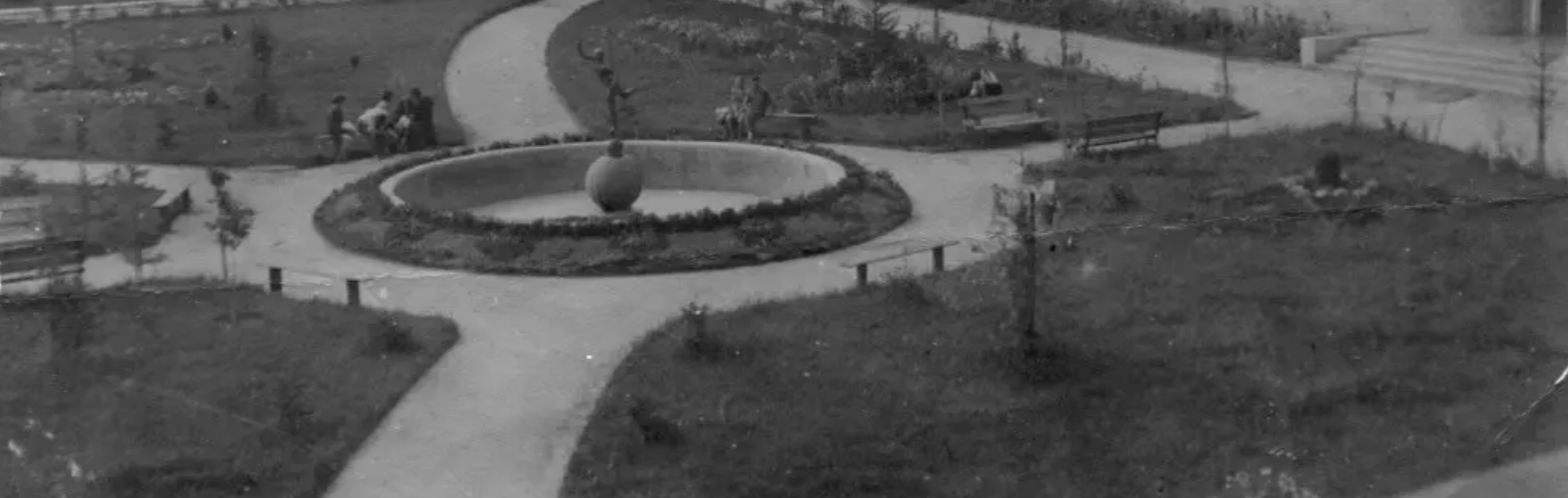
Ивановский интернациональный детский дом МОПР и стадион "Локомотив". 1930-е гг.