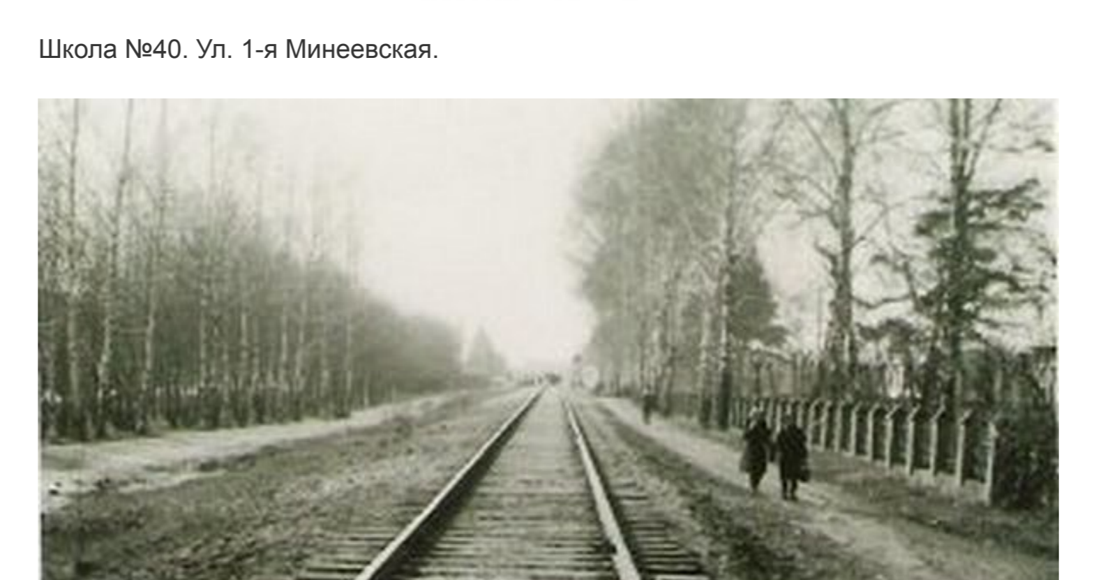
Дорога в школу