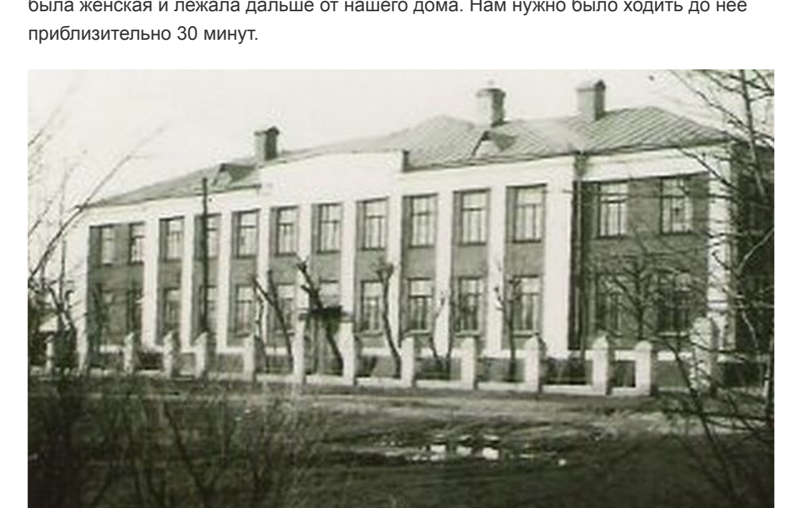
Школа №40. Ул. 1-я Минеевская.