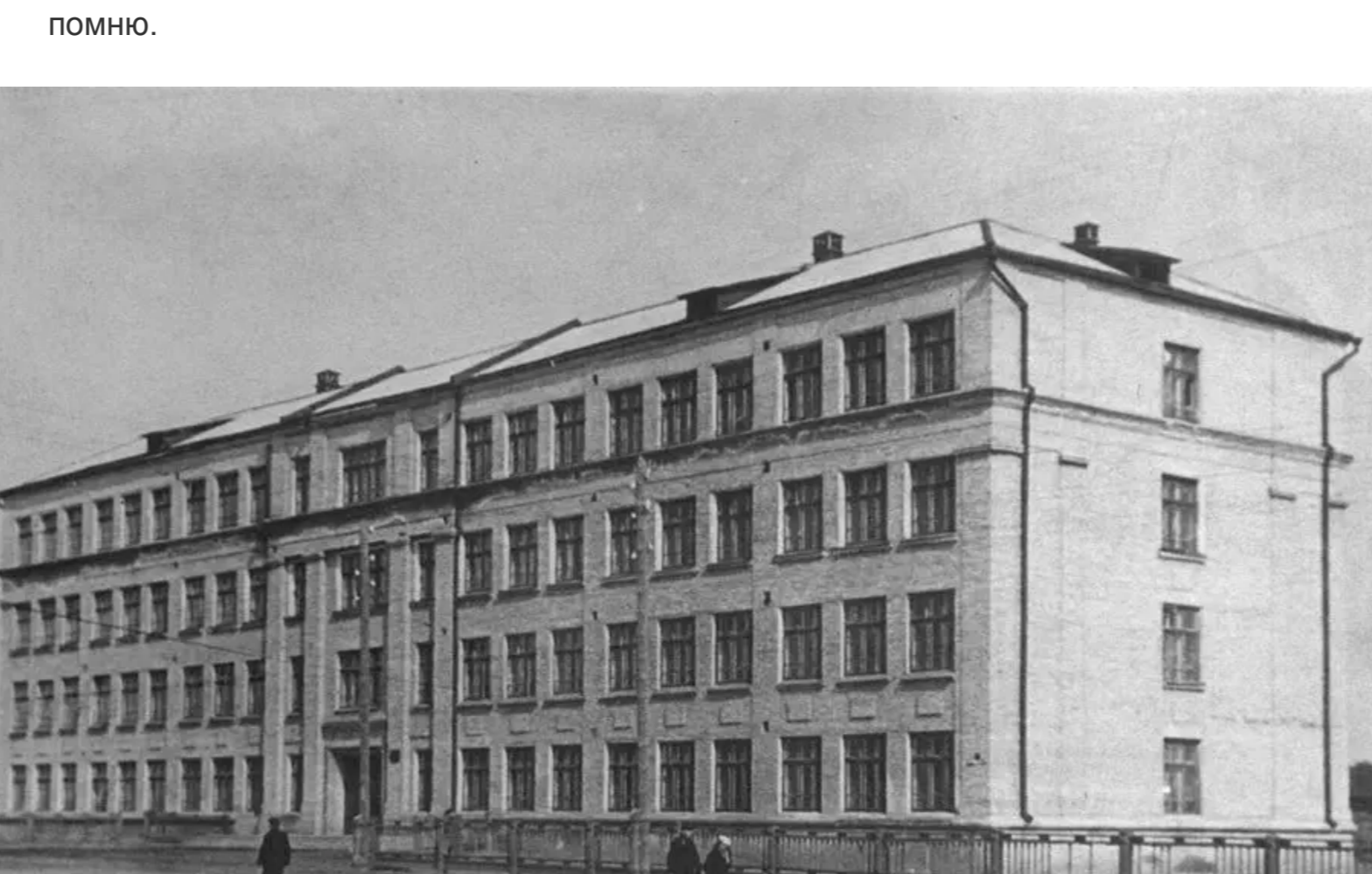
Ул. Большая Железнодорожная (сейчас ул. Полка "Нормандия-Неман") Школа №37. 1940 г.