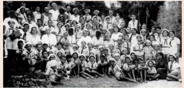
Niños de la Casa 7 (Pirogóvskaya) en el campamento de verano. Artek, 1937.

Posteriormente, las caras de los sojuzgados como “enemigos del pueblo” fueron tachadas. El artículo 58 del Código Penal de la URSS entró en vigor el 25 de febrero de 1927 para detener a las personas sospechosas de actividades contrarrevolucionarias. El artículo fue objeto de revisión en varias ocasiones, actualizándose con nuevos supuestos y recrudesciéndose al paso de la obsesión estalinista. En el articulado se desarrollaba el concepto “enemigo del pueblo”, diversificando grados e imputaciones: entre los traidores del apartado 58.1 y los saboteadores del 58.14, toda una galería de delirios se cernía sobre las víctimas.