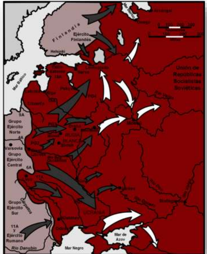
Ilustración 7. Mapa de la Operación Barbarroja.