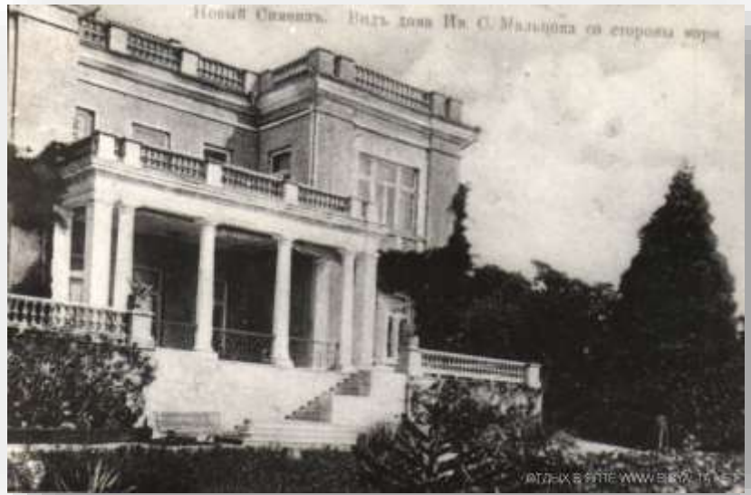
Ilustración 5. Casa de Ay Panda, Simeiz en Crimea. Ucrania, en su día, acogió a más de 400 niños españoles.

A su llegada a la URSS, los niños y niñas fueron acogidos en diferentes casas y villas, muchas de ellas pertenecientes a la antigua aristocracia rusa. Se conocieron como “Casas de niños” y en ellas pasarán los años venideros, estableciendo relaciones cuasi familiares y lazos estrechos que perduran hasta hoy. Fueron las siguientes: