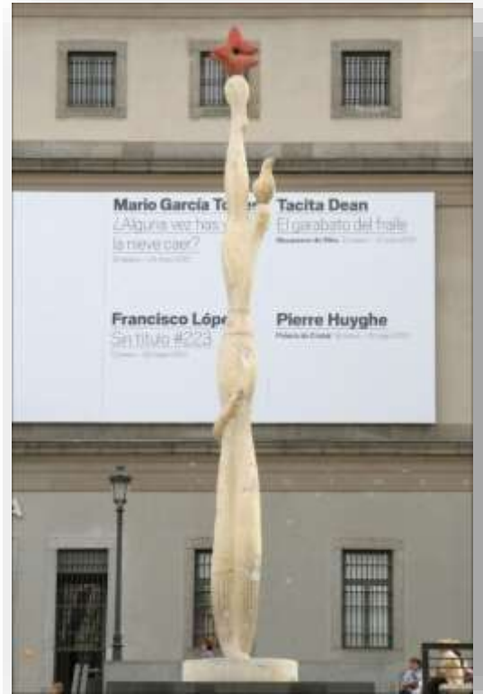
Ilustración 13. El pueblo español tiene un camino que conduce a una estrella. Obra de Alberto Sánchez.

Entre los emigrados adultos hubo figuras notables en el ámbito artístico, como los arquitectos Luis Lacasa y Manuel Sánchez Arcas (del movimiento arquitectónico conocido como “Generación del 25”), o pintores, dibujantes y escultores como Alberto Sánchez, José Sancha y Julián Castedo. De ellos, fue Alberto Sánchez quien mantuvo una relación más directa con los niños, ejerciendo como profesor de