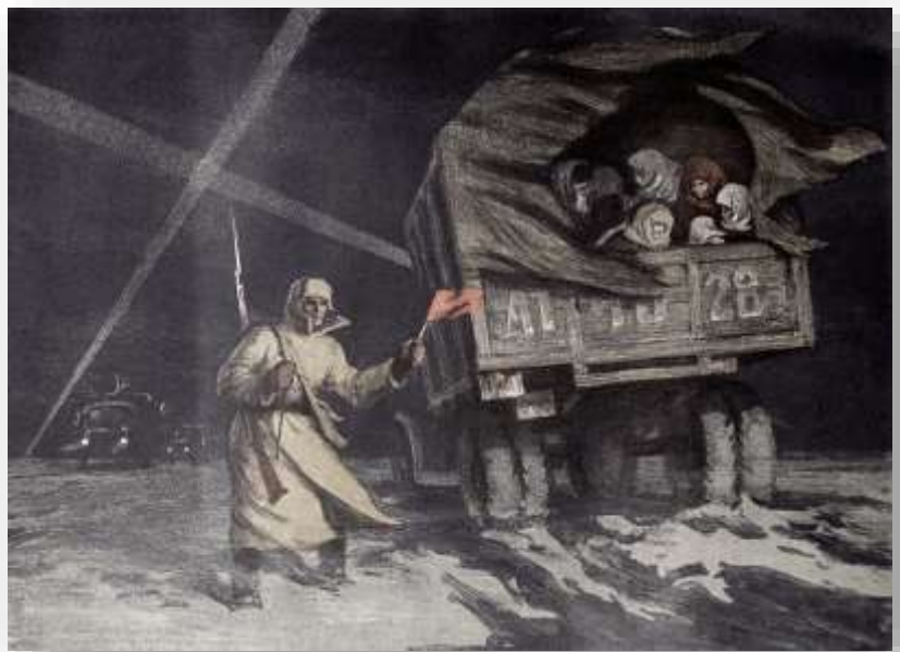
Ilustración 11. La evacuación del cerco.

El colectivo (menos de 100 españoles) emprende el trayecto, a pie, desde las Casas hasta la “Estación Finlandia” (de ferrocarril). En tren,