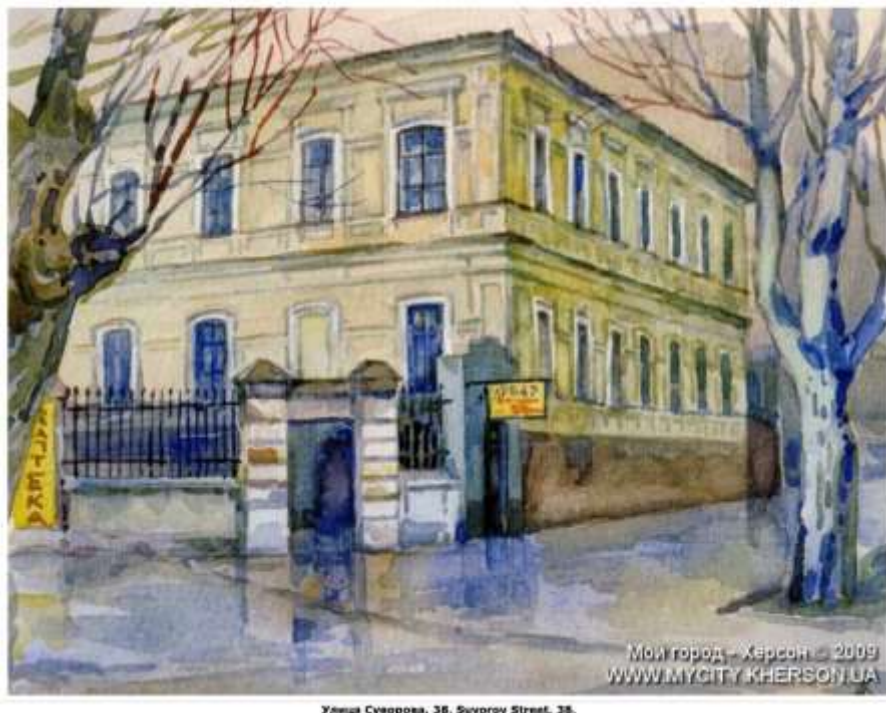
Ilustración 6. Casa de Jersson (Acuarela).

CASA DE JERSÓN (17) , Ucrania, conocida en ocasiones como “Bandera Roja” por el “palacio” en que pasaron los primeros meses en la URSS, entre junio y septiembre de 1937. 98 niños.