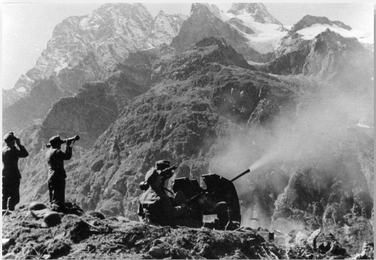
Ilustración 9. Batería alemana en el Cáucaso.

El empuje del ejército alemán provocó el movimiento del contingente de niños y niñas españoles que se encontraban en la URSS, provocando nuevas, peligrosas y homéricas huidas. Estos itinerarios y sus circunstancias se detallan a continuación. Además, en el siguiente enlace encontrarás información complementaria y detallada de las evacuaciones en la URSS. Enlace: https://www.ninosderusia.org/atlas-de-las-evacuaciones/