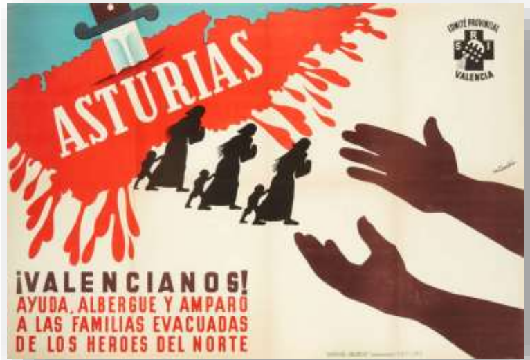
Ilustración 2. Cartel del Socorro Rojo Internacional alentando a ayudar a los hijos y familiares de los combatientes republicanos en Asturias.