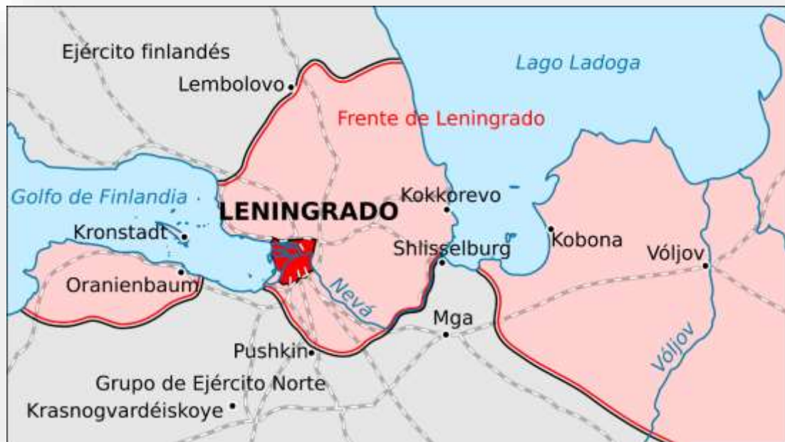
Ilustración 10. Situación del Cerco de Leningrado.

cercanía de los combates que tenían lugar en Stalingrado. El 14 de noviembre de 1943 ya había 142 alumnos en el orfanato: 85 niños y 57 niñas.