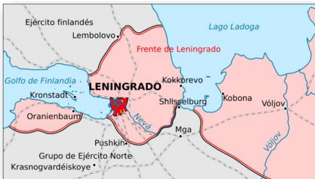
Ilustración 9. Situación del Cerco de Leningrado.

cercanía de los combates que tenían lugar en Stalingrado. El 14 de noviembre de 1943 ya había 142 alumnos en el orfanato: 85 niños y 57 niñas.