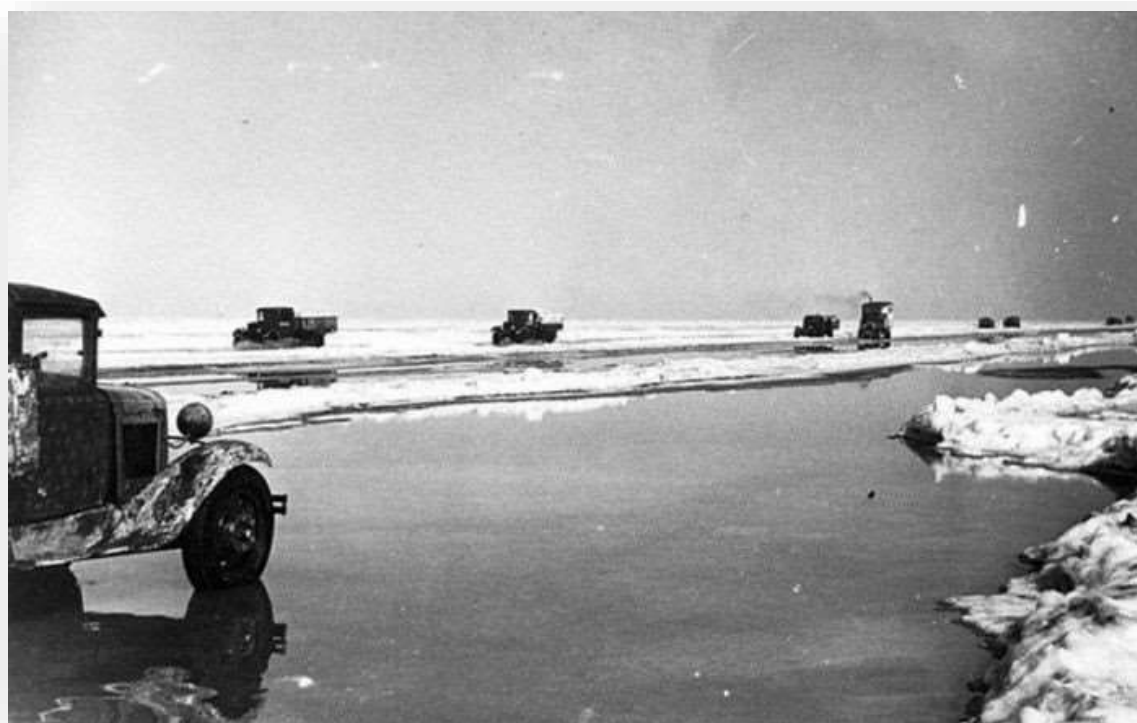
Ilustración 11. Camiones evacuando sobre el hielo del Ladoga.

En enero de 1942, se abrió el Cerco, que volvió a cerrarse en abril. A través del Ladoga helado, se reanudó la evacuación de la población civil. El 19 de marzo de 1942 lograba salir un contingente de 70 u 80 jóvenes españoles con sus maestros. Aquellos días de marzo la ciudad llegó a evacuar unas 15.000 personas por día. Salían por el “Camino de la Vida”, una vía de suministro y evacuación a través del lago Ladoga, sobre el hielo en camiones durante el invierno, y en embarcaciones durante el verano o deshielo, a partir de abril. Los jóvenes