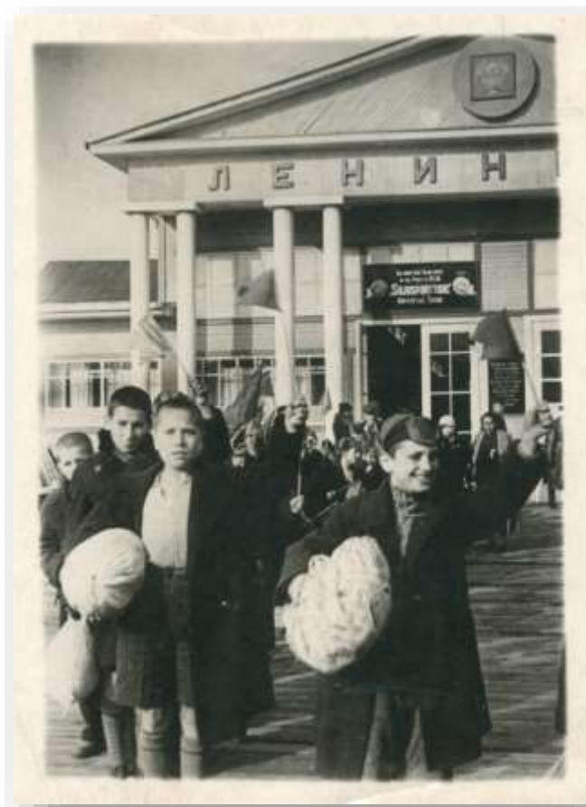
Ilustración 4. Llegada a Leningrado de un contingente de niños españoles.