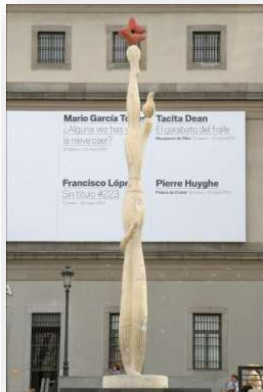
Ilustración 12. El pueblo español tiene un camino que conduce a una estrella. Obra de Alberto Sánchez.