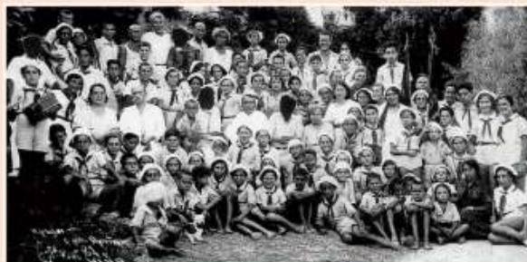
Niños de la Casa 7 (Pirogóvskaya) en el campamento de verano. Artek, 1937.