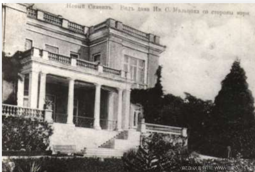
Ilustración 5. Casa de Ay Panda, Simeiz en Crimea. Ucrania, en su día, acogió a más de 400 niños españoles.

A su llegada a la URSS, los niños y niñas fueron acogidos en diferentes casas y villas, muchas de ellas pertenecientes a la antigua aristocracia rusa. Se conocieron como “Casas de niños” y en ellas pasarán los años venideros, estableciendo relaciones cuasi familiares y lazos estrechos que perduran hasta hoy. Fueron las siguientes: