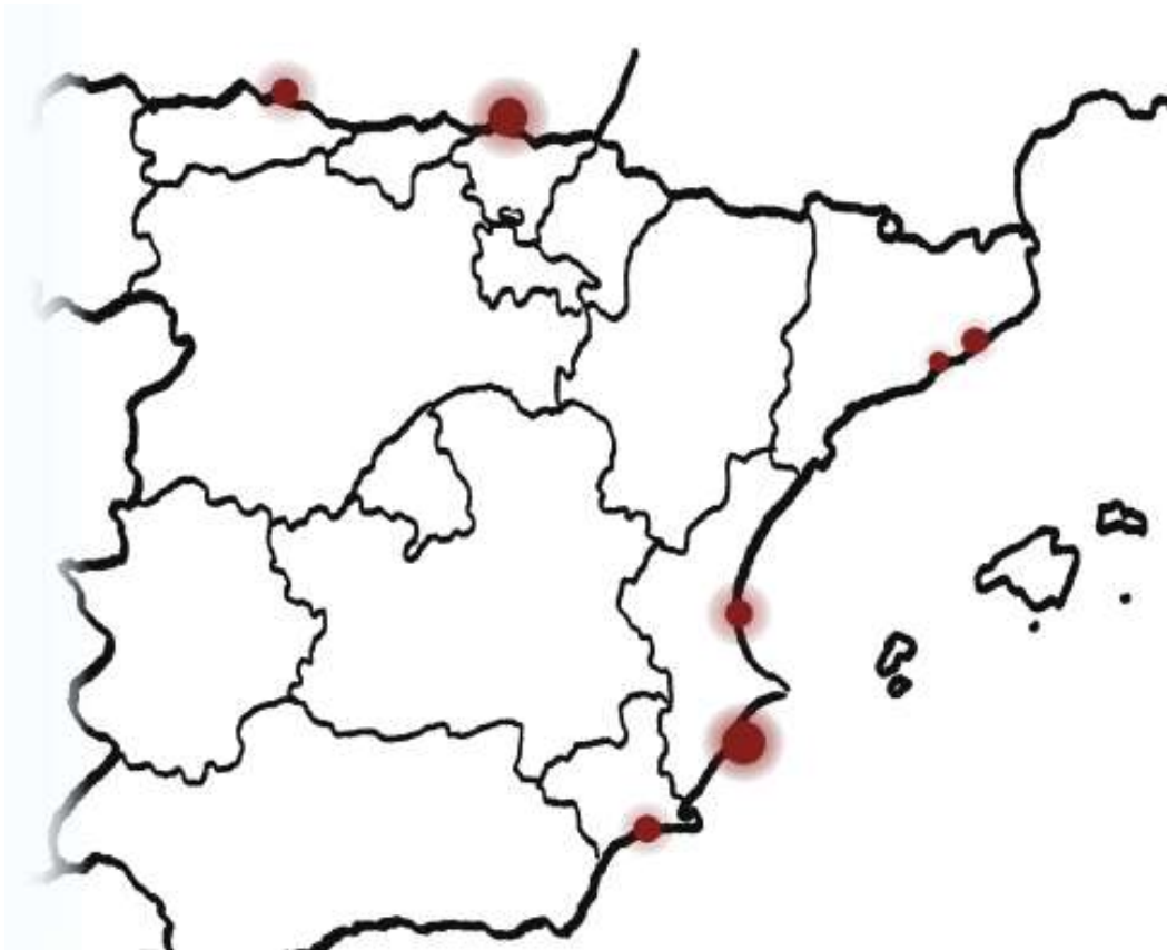
Ilustración 3. Puntos de partida de las evacuaciones. Gijón, Santurce, Barcelona, Cartagena y Alicante. Mapa de Elaboración propia (Atlas de las evacuaciones).