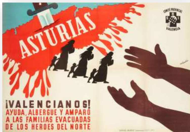
Ilustración 2. Cartel del Socorro Rojo Internacional alentando a ayudar a los hijos y familiares de los combatientes republicanos en Asturias.

Colonias Escolares: Antes de la guerra, ponían en práctica los ideales pedagógicos del krausismo y de la Institución Libre de Enseñanza (1876). Ambas corrientes defendían la educación activa, liberadora e integral, con especial atención a la actividad en un medio sano y natural. Las Colonias de Salinas, en Asturias, como las de Levante, se transformaron durante la guerra en espacios de acogida y refugio desde los que se organizaron las evacuaciones al extranjero, que comienzan en la primavera de 1937.