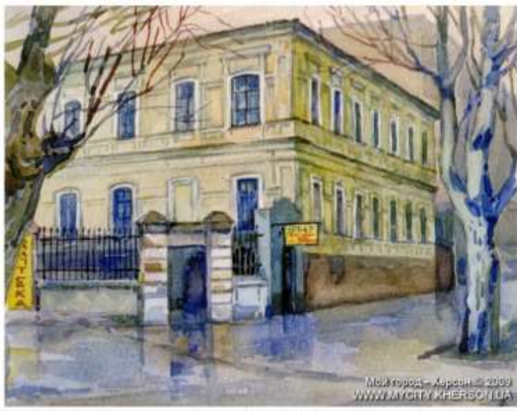
Ilustración 6. Casa de Jersson (Acuarela).

CASA 2. KRASNOVÍDOVO , cerca de Mozhaisk, región de Moscú. 274 niños, 196 empleados rusos y 21 españoles.