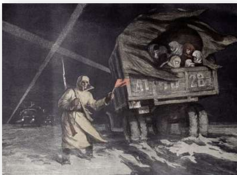
Ilustración 10. La evacuación del cerco.

El colectivo (menos de 100 españoles) emprende el trayecto, a pie, desde las Casas hasta la “Estación Finlandia” (de ferrocarril). En tren,